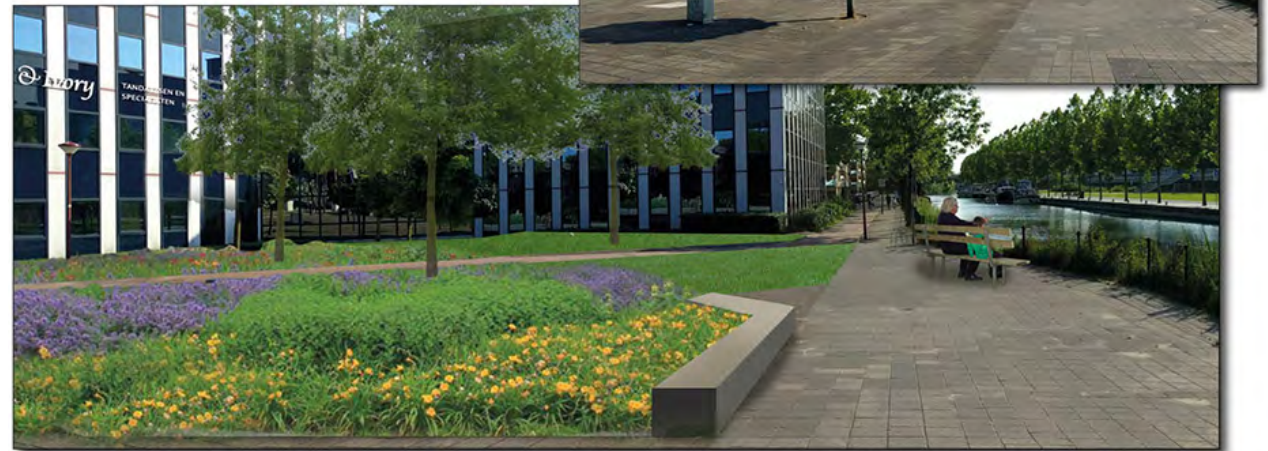
Ontstenen en vergroenen Zavelwal, gemeente Nieuwegein